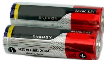
图 3 电动机及电池外观（供参考）