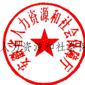
安徽省人力资源和社会保障厅