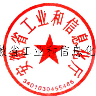
安徽省工业和信息化厅