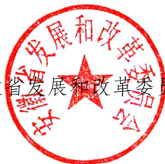
安徽省发展和改革委员会