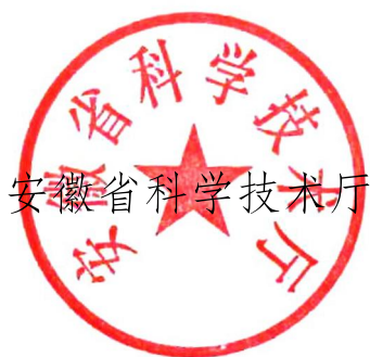
安徽省科学技术厅

人员创新创造活力，针对赋权改革的痛点和堵点，编制了《关于打造职务科技成果赋权改革试点 2.0 版若干举措》。现印发你们，请认真抓好贯彻落实。